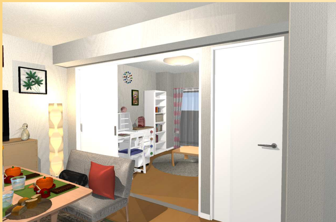
洋室1を子供部屋にする。 家事をしながらお子様の気配を感じる事が出来ます