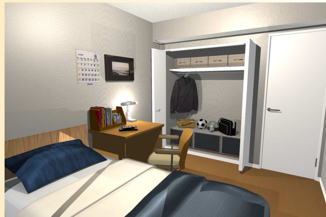
洋室2。収納も充実のプライベートルーム

パース内の家具、装飾などはCGによるイメージ画像で、実際には含まれません。 また一部現況と異なる場合がございます。何卒ご了承下さい。