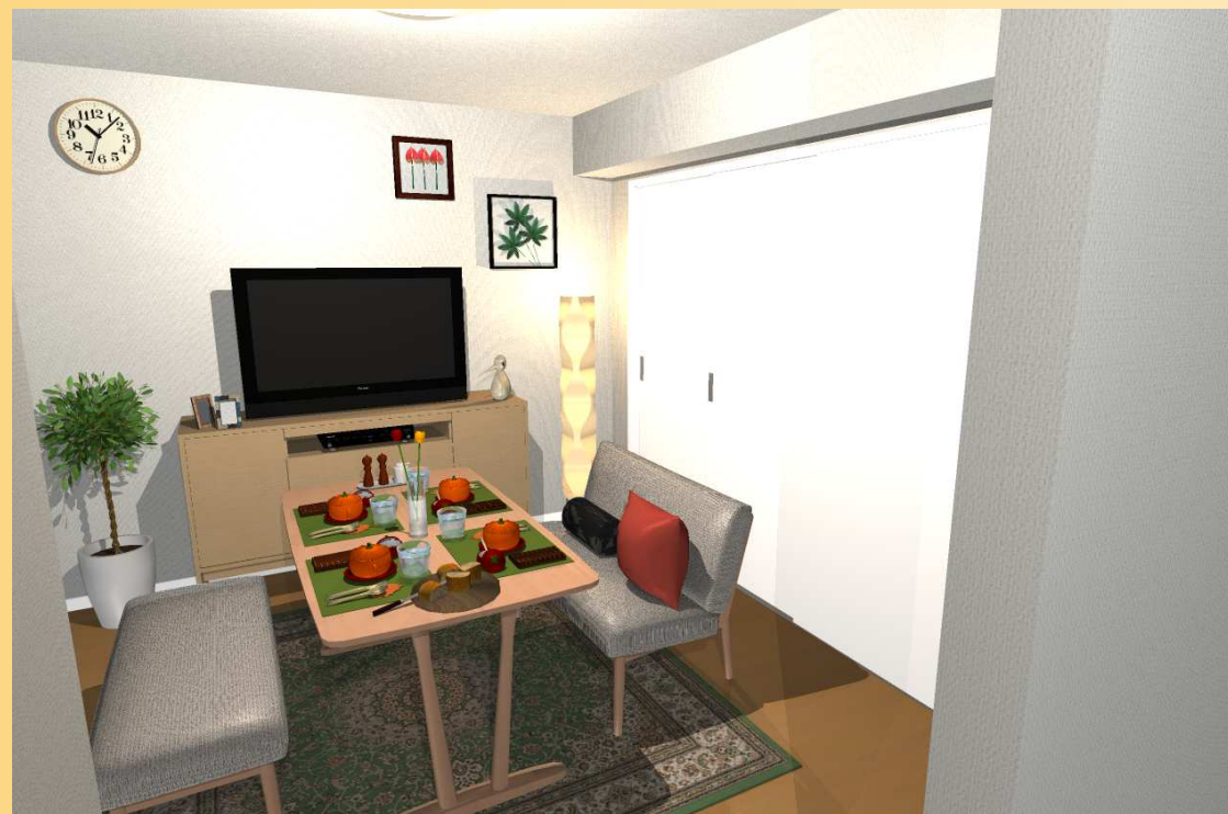
ダイニング&リビングとして。 または、ダイニング、洋室1をリビングとして配置する事も