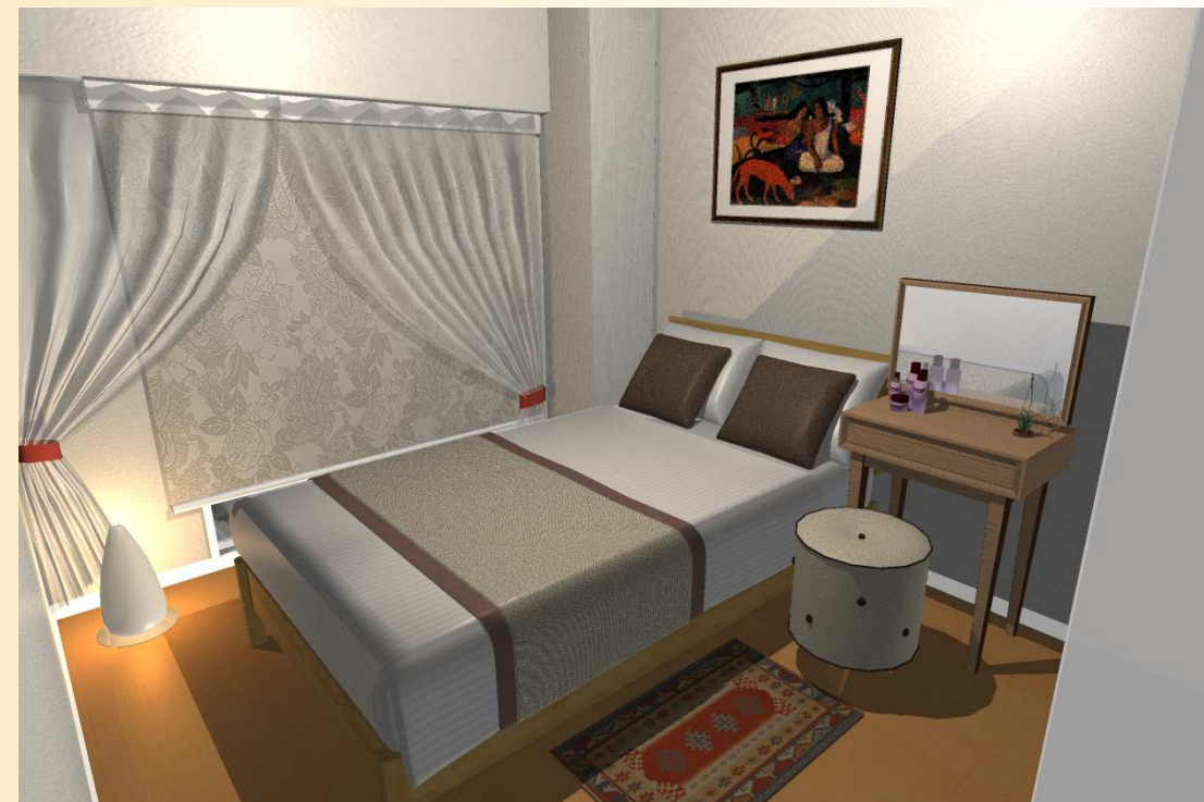
洋室2【主寝室】自然光の差し込む落ち着いた空間