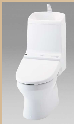
ウォシュレット一体型トイレ 新HV