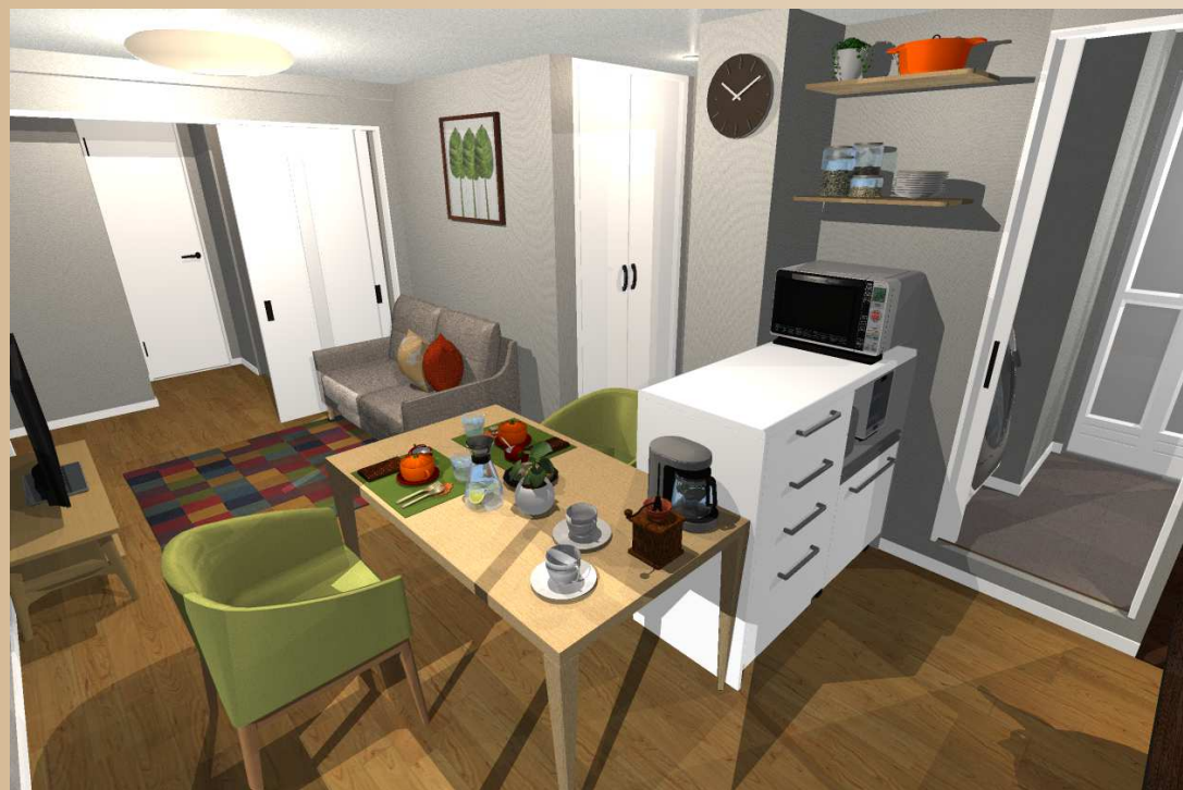
家具のレイアウトで様々なスタイルに