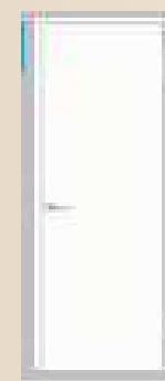
しっくいホワイト柄