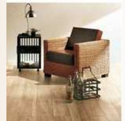
ビンテージオーク