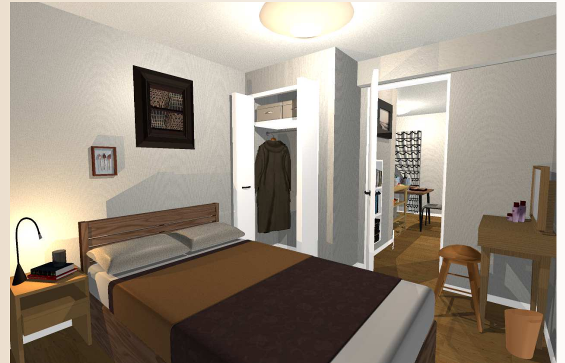
落ち着いたプライベート空間