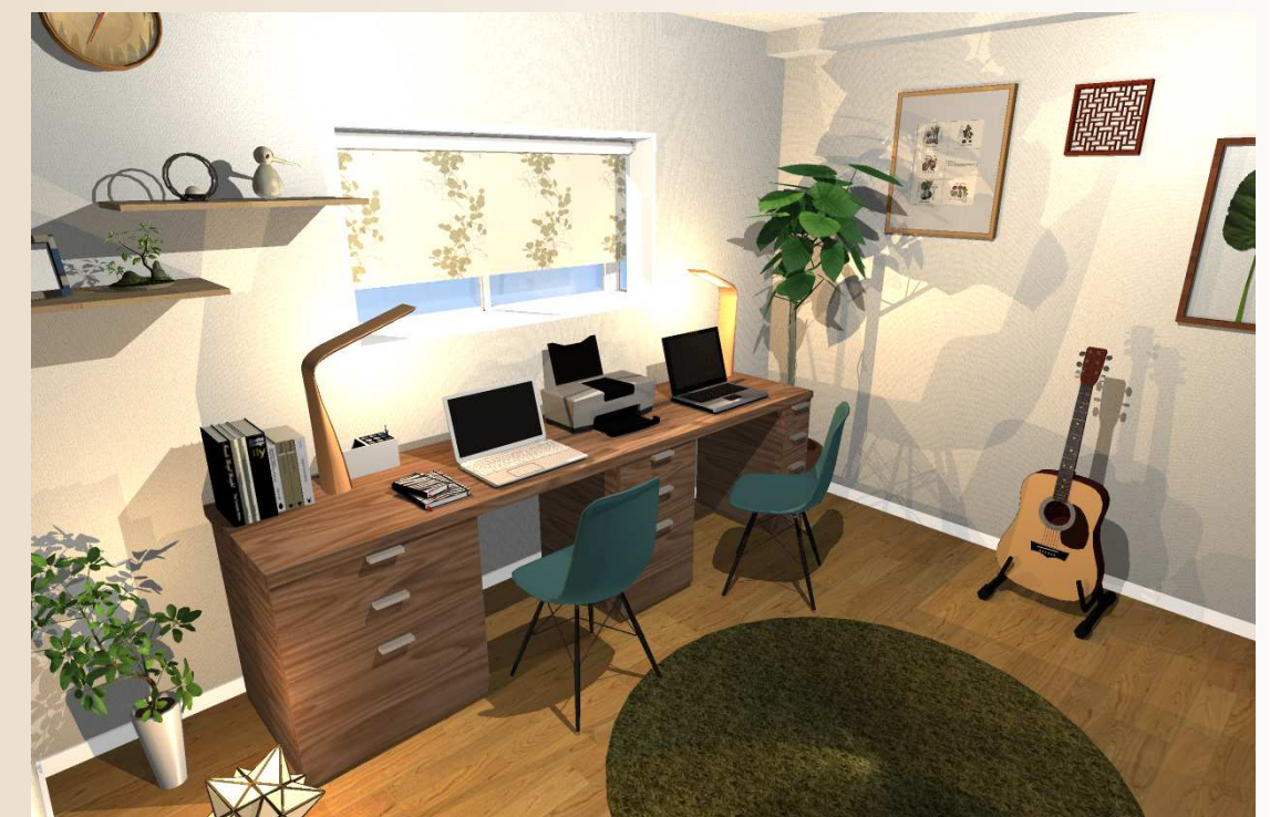
書斎や趣味の空間として

パース内の家具、装飾などはCGによるイメージ画像で、実際には含まれません。また一部現況と異なる場合がございます。何卒ご了承下さい。